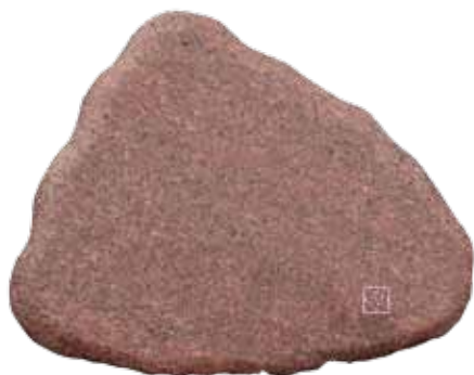
Indfældet i gravsten.