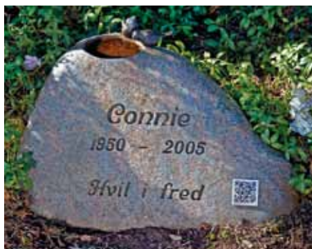
Indfældet i sten på kirkegård.