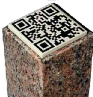
Monteret på granitsokkel.